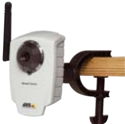
AXIS 207/207W/207MW Network Camera con morsetto flessibile (fornita con il prodotto)