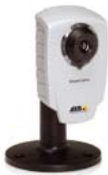
AXIS 207/207W/207MW Network Camera con base (fornita con il prodotto)