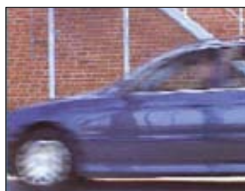
Interlacciamento, 20 ms di differenza tra le linee pari e dispari