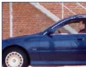
Progressive Scan per l'acquisizione concomitante di tutte le linee

Viene utilizzata la tecnologia Progressive Scan anziché il metodo di interlacciamento tipico delle telecamere CCTV (PAL/NTSC) analogiche. Questa tecnologia consente di acquisire contemporaneamente tutti i pixel (linee) e di riprodurre immagini in movimento senza distorsioni.